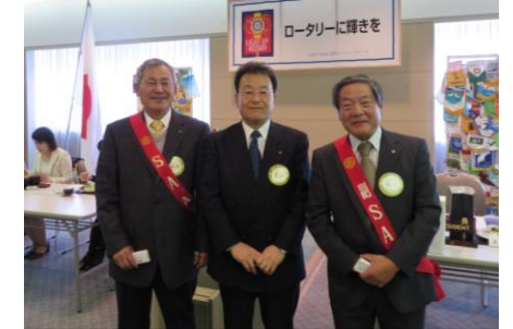
脇田会員皆出席 23年 森元会員 皆出席 1年