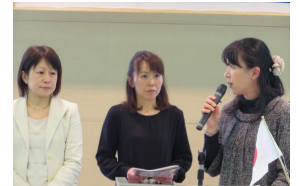
けいはんなベリーズの皆様