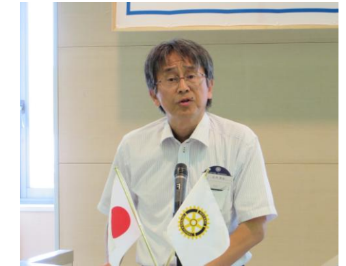
「最近の中学生について」